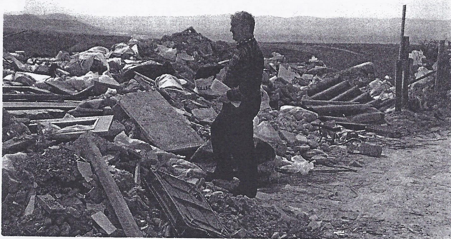
Imagen de la escombrera, con todo tipo de basura hasta la misma puerta, el pasado 15 de marzo.

En varios Plenos hemos planteado el tema de los vertidos incontrolados en la escombrera de Puente la Reina/Gares. Hemos preguntado por escrito a la Ximénez de Rada qué han hecho para solucionar el problema, pero desde hace muchos meses no responden a lo que presentamos en el Ayuntamiento, incluso por escrito, incumpliendo con ello lo que dice la Ley.